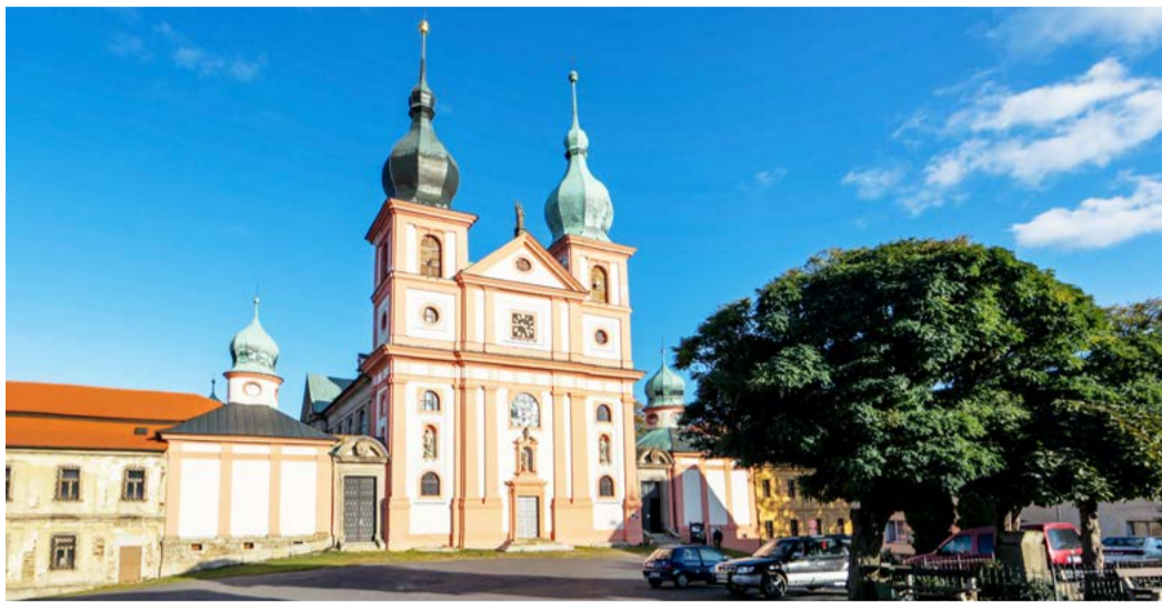
Barokní památky Areal probošství Chlum Svaté Maří