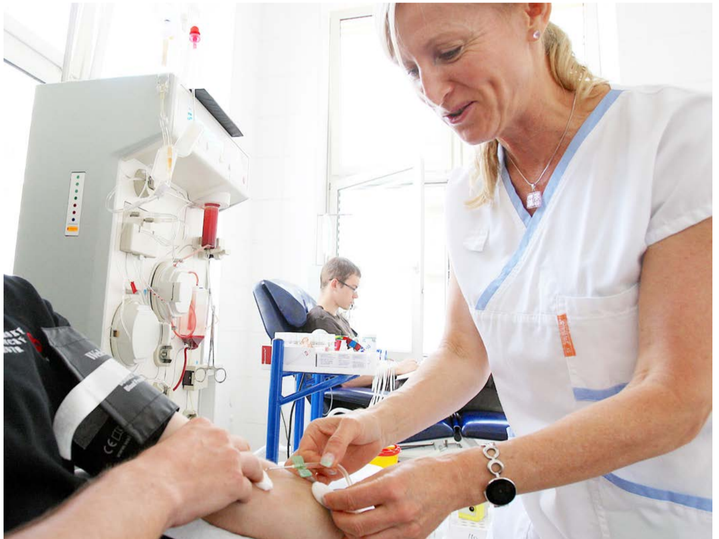
Dárcovství krve pomáhá zachraňovat zdraví a životy lidí