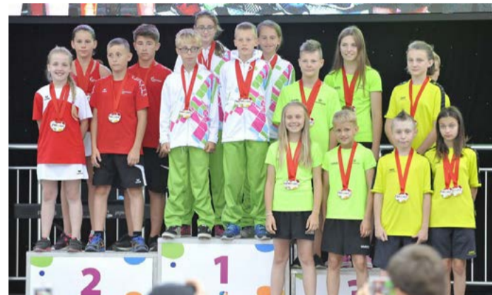
Karate kumite team mladší žáci a žákyně