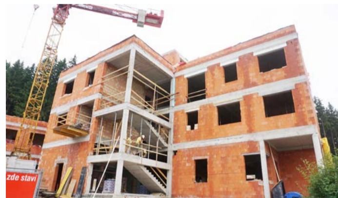
Budova hospicové péče, kterou kraj nechává vystavět v Nejdku, bude dokončena v únoru 2018.

Kromě výstavby kamenného hospice podporuje Karlovarský kraj také mobilní hospicové služby napříč